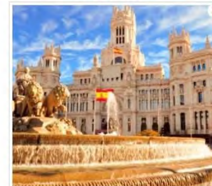
Vuela a Madrid saliendo de Cali